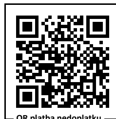
QR platba nedoplatku

Způsob úhrady převodní příkaz Datum splatnosti 19. 08. 2022 Bankovní spojení Komerční banka, a.s. Číslo účtu 107-3954680207/0100 Variabilní symbol 6822179624