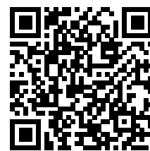
QR platba zálohy

převodní příkaz nejpozději do 15. dne v měsíci Komerční banka, a.s. 107-3954680207/0100 1901173834